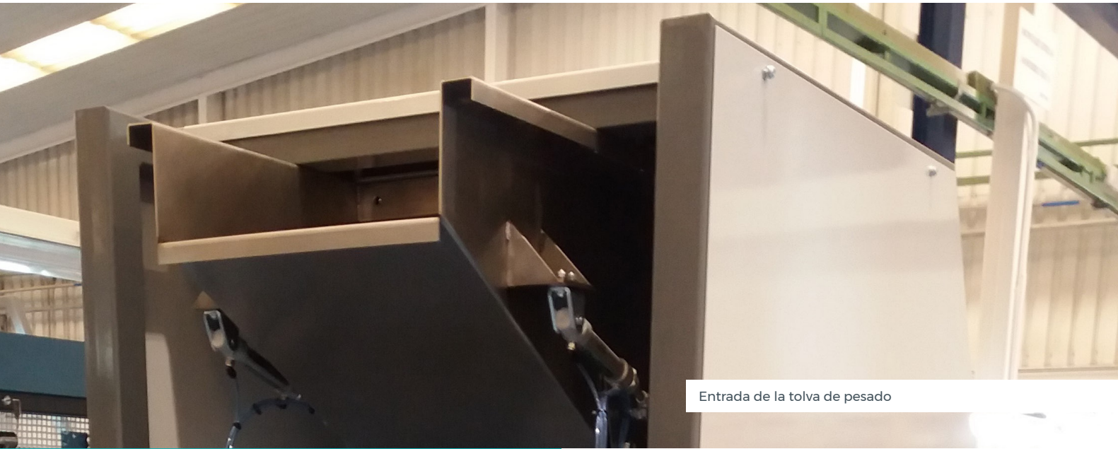
Entrada de la tolva de pesado