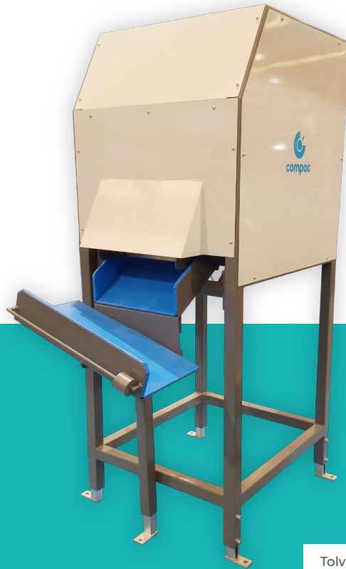
Tolva de pesado