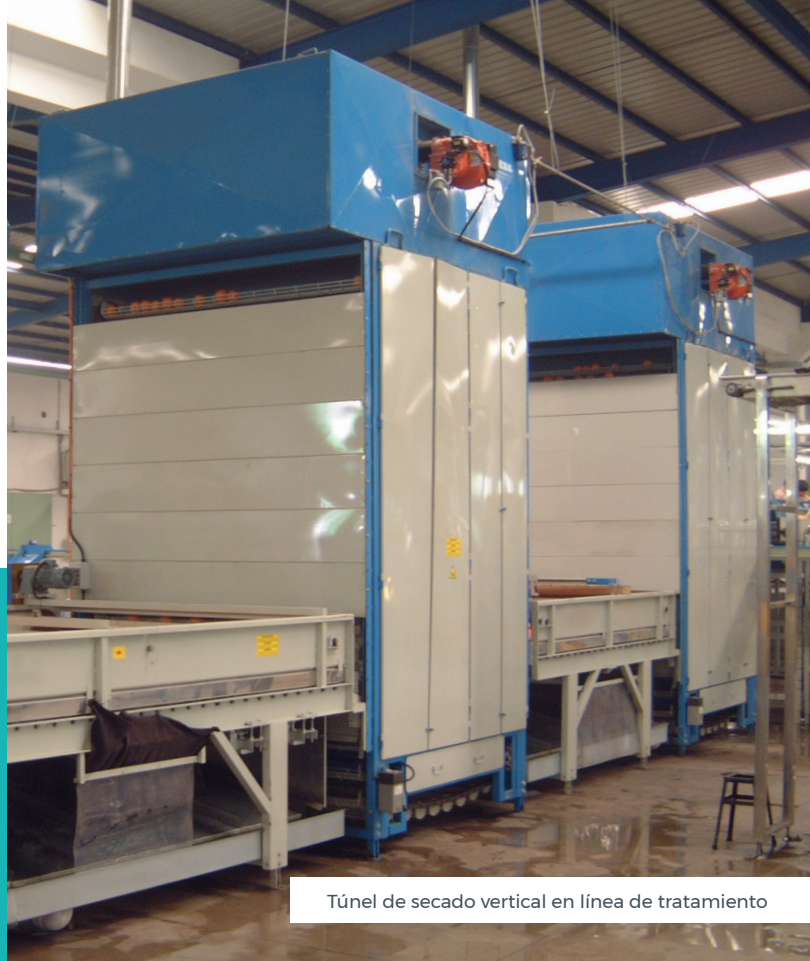
Túnel de secado vertical en línea de tratamiento