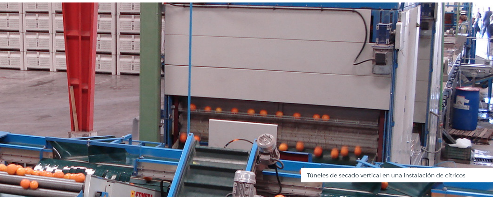
Túneles de secado vertical en una instalación de cítricos