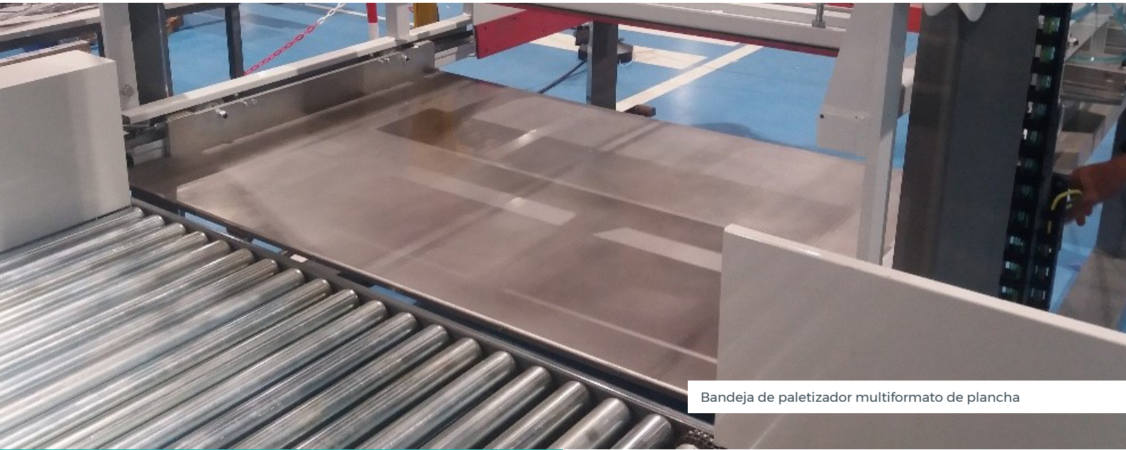
Bandeja de paletizador multiformato de plancha