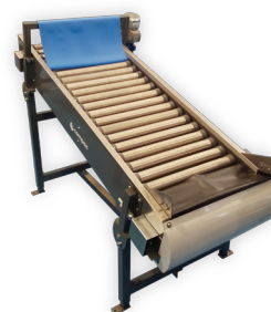
Transportador de rodillos