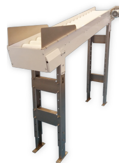
Elevador de correa ondulada

Si desea obtener más información o comentarnos los requisitos específicos de su empresa, por favor visite www.sienz.com