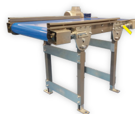
Transportador de correa