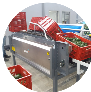
Fases del volcado de cajas