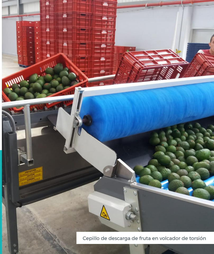
Cepillo de descarga de fruta en volcador de torsión