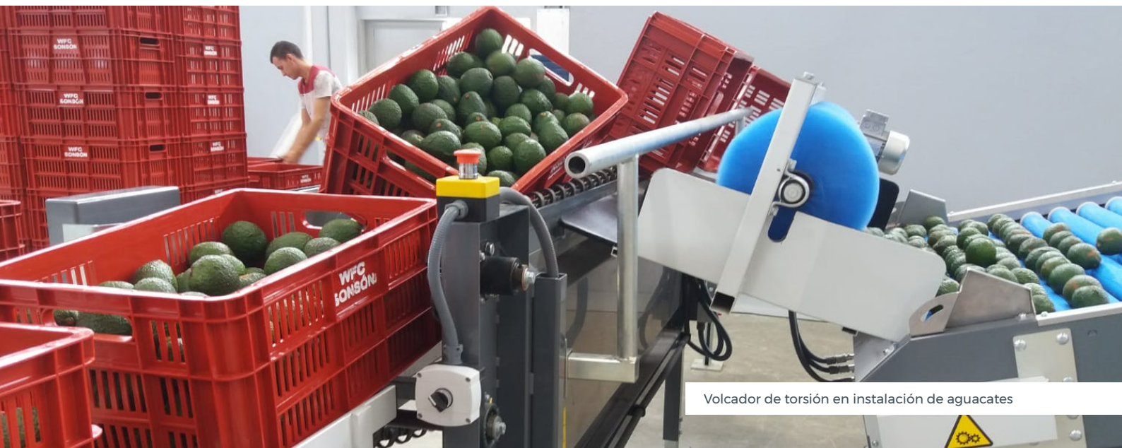
Volcador de torsión en instalación de aguacates